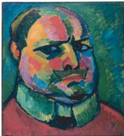
Alexej von Jawlensky, Selbstbildnis, 1912.