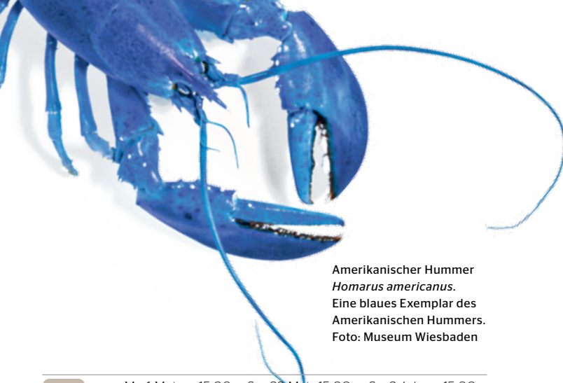
Amerikanischer Hummer Homarus americanus . Eine blaues Exemplar des Amerikanischen Hummers.